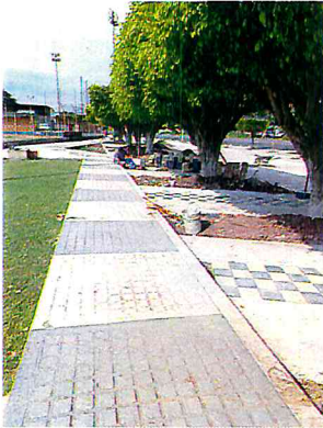
CONSTRUCCION DE PASEO COMERCIAL, CULTURAL Y DEPORTIVO