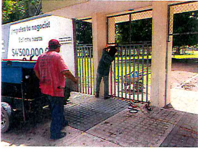
QUITAR PUERTAS DE INGRESO A LA UNIDAD DEPORTIVA MUNICIPAL