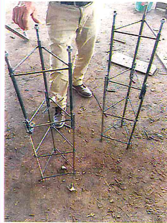
HACER BASES PARA SISTEMA DE TIERRAS DE LA OBRA PASEO COMERCIAL