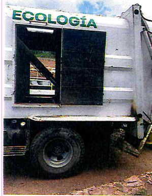
SOLDAR CAMIONETA PRENSA DE ECOLOGIA