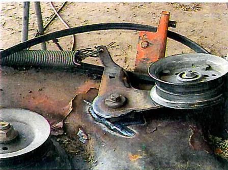
SOLDAR PODADORA DE SERVICIOS PUBLICOS MUNICIPALES