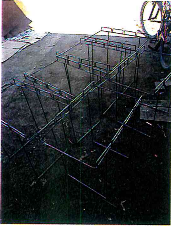
HACER BASES PARA COLOCAR BOLSAS DE SEPARADOS