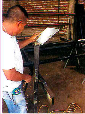
HACER BASES PARA PLACA INFORMATIVA DE ARBOLES