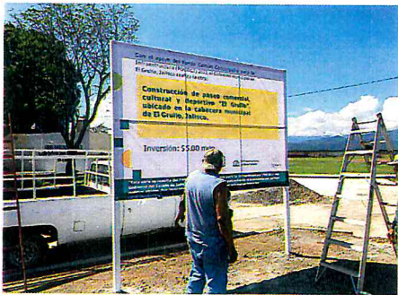
HACER ESTRUCTURA Y COLOCACION DE LONA DEL PROGRAMA FOCOCI 2022