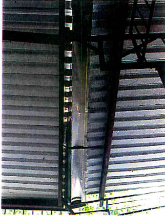
CAMBIAR CANALEJA DEL DIF MUNICIPAL