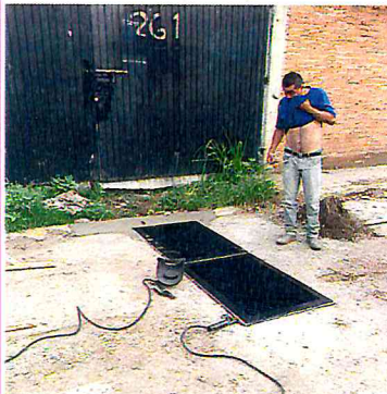
FABRICACION Y COLOCACION DE REJA PARA BOCA DE TORMENTA POR LA CALLE CUAUHTEMOC