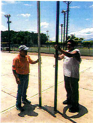
HACER POSTES PARA MALLA DE VOLEIBOL DEL CANCHA DEL DOMO MUNICIPAL