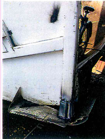
SOLDAR Y REFORZAR CAMION PRESA DE LA BASURA

A large, stylized blue signature or stamp.