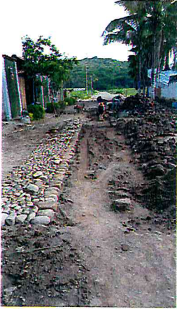
REEMPEDRADO CALLE PUEBLA