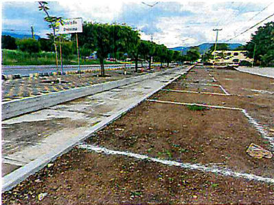
TRAZO DE LOCALES COMERCIALES EN LA OBRA DE PASEO COMERCIAL (PROGRAMA FOCOCI 2022)