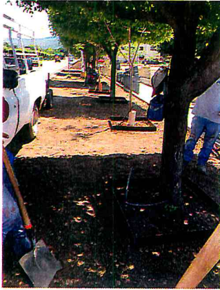
INSTALACION Y FIJACION DE MARCO PARA CAJETES