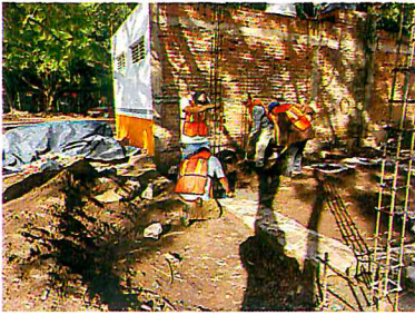
CONSTRUCCION DE BAÑOS EN LA OBRA DE PASEO COMERCIAL (PROGRAMA FOCOCI 2022)