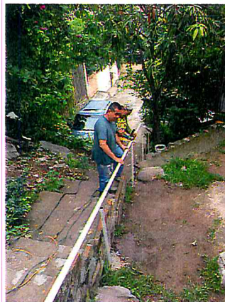
HACER PASAMANOS DE LA PRIV. CARMEN SERDAN