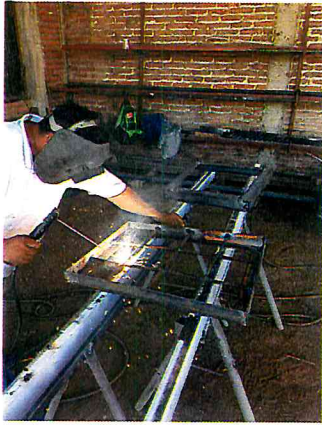
HACER MARCOS PARA REGISTROS DE ELECTRICIDAD