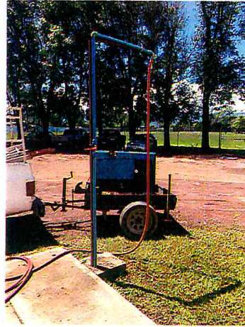
HACER BASE PARA SOSTENER SISTEMA DE LLENADO DE AGUA A LOS VEHICULOS DE LOS BOMBEROS