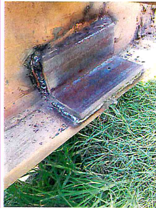
REFORSAR Y SOLDAR CAMA BAJA DE OBRAS PUBLICAS