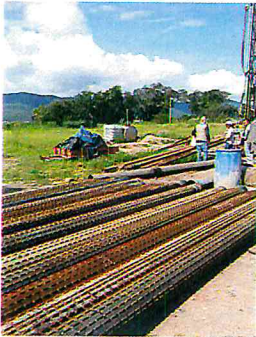
SE CONTINUA CON LA PERFORACION DE POZO EN LA COL. VALLE DE EL GRULLO