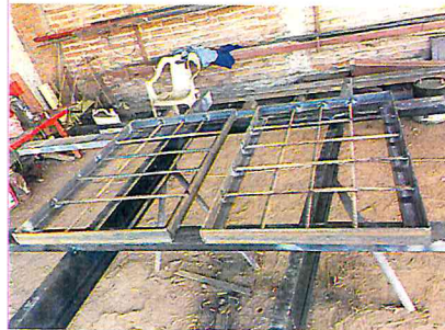
HACER MARCOS PARA REGISTRO ELECTRICOS