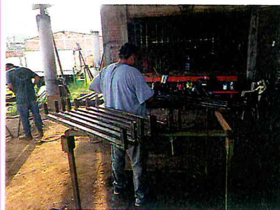
PINTAR ESTRUCTURA DE FORO MOVIBLE DEL JARDIN MUNICIPAL

A large, stylized blue signature written in ink. The signature is written in a cursive style and is located at the bottom of the page.