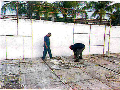
ARMAR Y FIJAR ESTRUCTURA SOBRE FORO DEL JARDIN MUNICIPAL